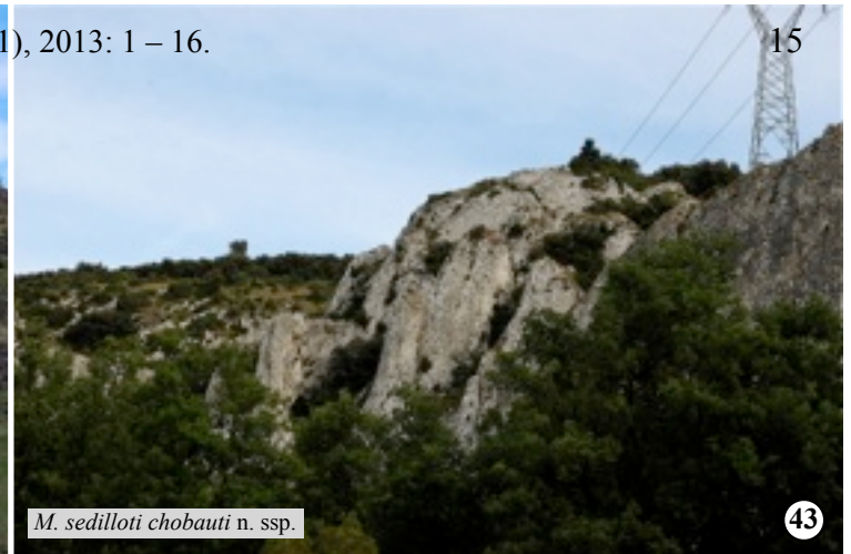
M. sedilloti chobauti n. ssp.